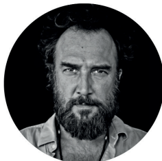
CARLOS LEAL Musician & Actor

«Meeting you, allowing myself the pleasure of having your company, made me the luckiest man alive. I hope one day you will sign your book for me as I stand patiently in a long line for it!»